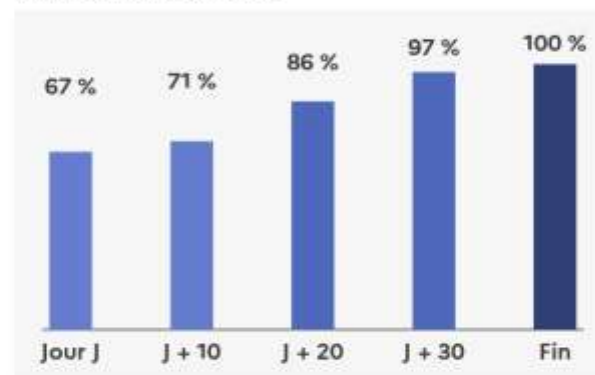
Rythme d'envoi des propositions d'admission en 2022